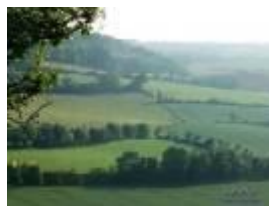
Paisaje agrario con setos

Los campesinos desposeídos hubieron de desplazarse a las ciudades en busca de sustento o a convertirse en jornaleros. Con ello la actividad agrícola dejó de ser un bien heredado y destinado a la subsistencia para convertirse en una empresa regida por las leyes del mercado, orientada al logro de beneficios y ejercida por asalariados.