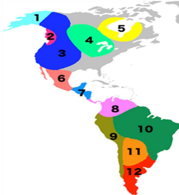
MAPA DE LOS GRUPOS GENÉTICOS